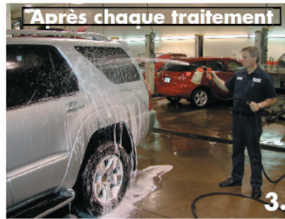
Après chaque traitement