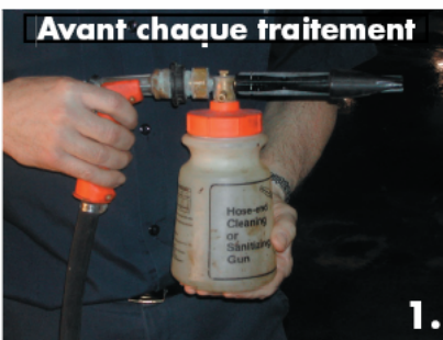
Avant chaque traitement