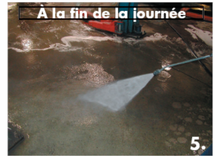
À la fin de la journée