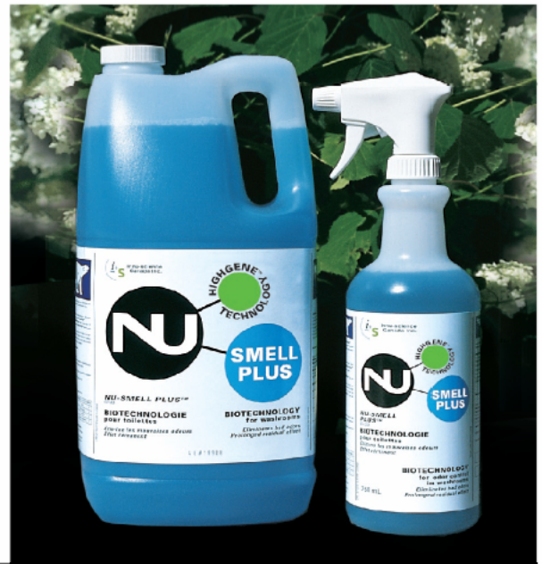
NU-SMELL PLUS™ IS-33